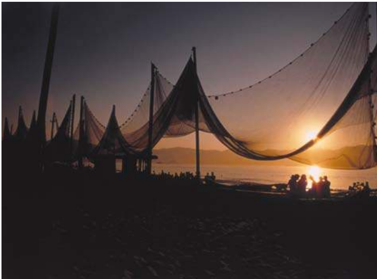
Fishermen Under Nets at Sunset. Gajim/