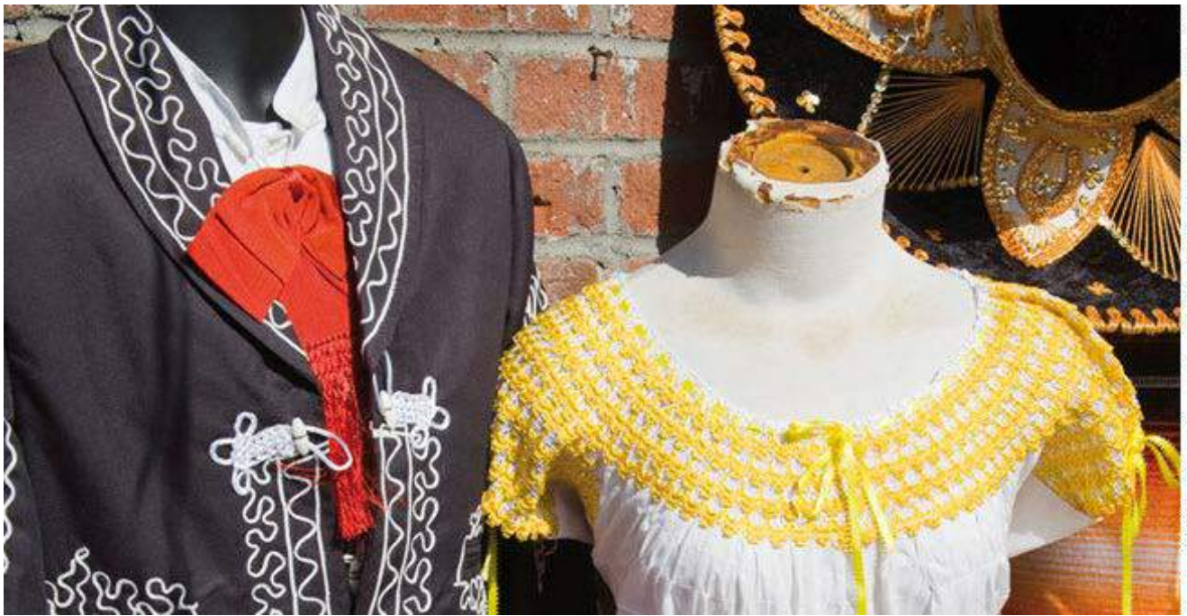
Mexican Clothing Store, Olvera Street, El Pueblo Historical Monument.